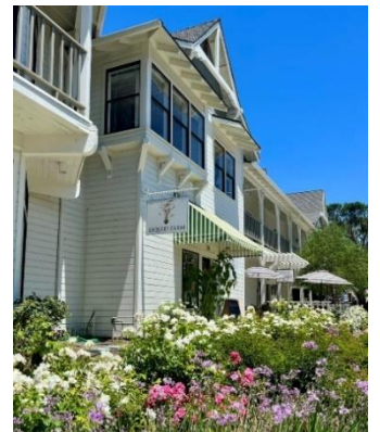
ロス・オリボスにある テイastingルーム

二人の目標は、地上と地下で何が起きているのかを知ってもらい、その両方がワインと切っても切れない関係にあるということ伝えることです。ワインは結局のところ、大地と人間の手によって生み出されたもので、農作業からの液体だということ＝「It is Liquid from Farming」。その思いは、ロゴにも託しています。彼らが愛するタンポポに球根と色を付け、地下にあるものを地上へと運ぶ花（比喩的にブドウ）にしたデザインで、中央をかすかに走る線で“地上と地下”を表現しています。