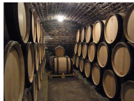
醸造所の地下にある樽熟庫

一方でワイン醸造に関しては、クリスチャンの造り方と全く変えていません。収穫後は厳格に選果を行い (2回)、100%除梗。1週間ほどの低温マセラシオン後に、ステンレスタンクでおよそ3週間かけて発酵します。熟成はブルゴーニュ・ルーージュを除き100%新樽を使用。約18ヶ月間の長期熟成を行います。木樽はフランソワ・フレール、タランソー、セガン・モロー、シャッサンなど複数の樽会社の樽を、畑毎に使い分けています。例えばエレガントな味わいのFontenyは柔らかい味わいに仕上がるアリエ産の樽を使います。より力強い味わいのCharmesやCazetiersは、その味わいを支える強さを持つトロンセ産の樽を使用します。近年フレデリックは樽の焼き具合にも大きな拘りを持ち、毎年試行錯誤を重ねています。また1990年以降は壺詰前のフィルター処理も卵白清澄処理も行っていない。