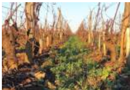
■冬のシャルドネの畑の様子。 2020年より完全有機栽培へと移行中。畝間には雑草を生やしている。